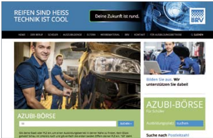
Wird noch zu wenig genutzt: die Ausbildungs- und Praktikumsplatzbörse auf der Website www.deine-zukunft-ist-rund.de , dem zentralen Element der BRV-Ausbildungskampagne.