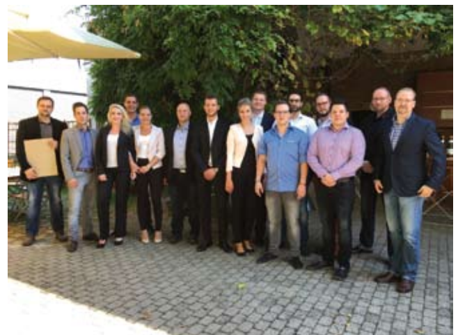
Auf zwölf Männer kamen drei Frauen: Die Absolvent/innen des BRV-Juniormanager-Lehrgangs 2016.