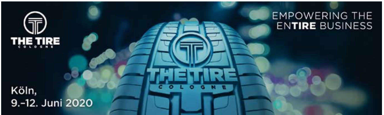
Die Struktur der zweiten internationalen Branchenleitmesse THE TIRE COLOGNE nimmt Formen an: Gut neun Monate vor Messebeginn waren fast 70 Prozent der geplanten Ausstellungsflächen bereits vermietet.

Die Struktur der THE TIRE COLOGNE für die zweite Auflage vom 09.-12.06.2020 nimmt Formen an. Zum Redaktionsschluss dieser T&F-Ausgabe und damit gut neun Monate vor Messebeginn sind fast 70 Prozent der geplanten Ausstellungsflächen bereits vermietet. „Das wichtigste Ziel einer Messe, nämlich die umfassende Marktabbildung, haben wir bereits erreicht. Nahezu 300 Unternehmen haben ihre Teilnahmen an der THE TIRE COLOGNE 2020 bestätigt, darunter fast alle namhaften Key Accounts aus den Schwerpunktsegmenten. So präsentiert die THE TIRE COLOGNE als weltweit einzige B2B-Plattform die Top 5 der internationalen Reifenwelt“, sagt Ingo Riedeberger, Director der THE TIRE COLOGNE. „Aktuell sind wir neben den intensiven Ausstellergesprächen vor allem in der Planung des Kongress- und Eventprogramms der THE TIRE COLOGNE, mit dem wir zusätzliche Impulse setzen wollen“.